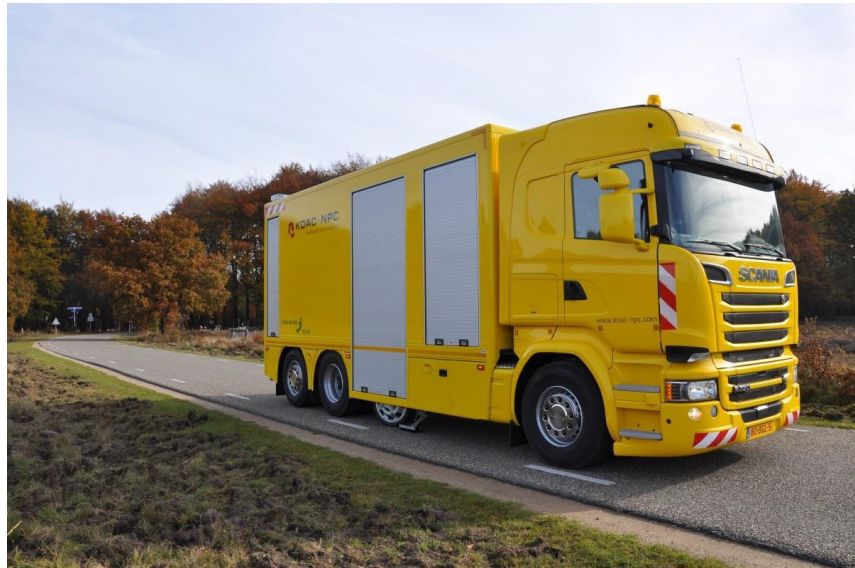
Abbildung 1 Messsystem

Die Messgeräte sind im Messfahrzeug integriert. Abbildung 1, Abbildung 2 und die schematische Skizze in Abbildung 3 verleihen einen Eindruck des Messsystems. Das Messrad steht in einem Winkel von 20^\circ zur Fahrrichtung und läuft frei.