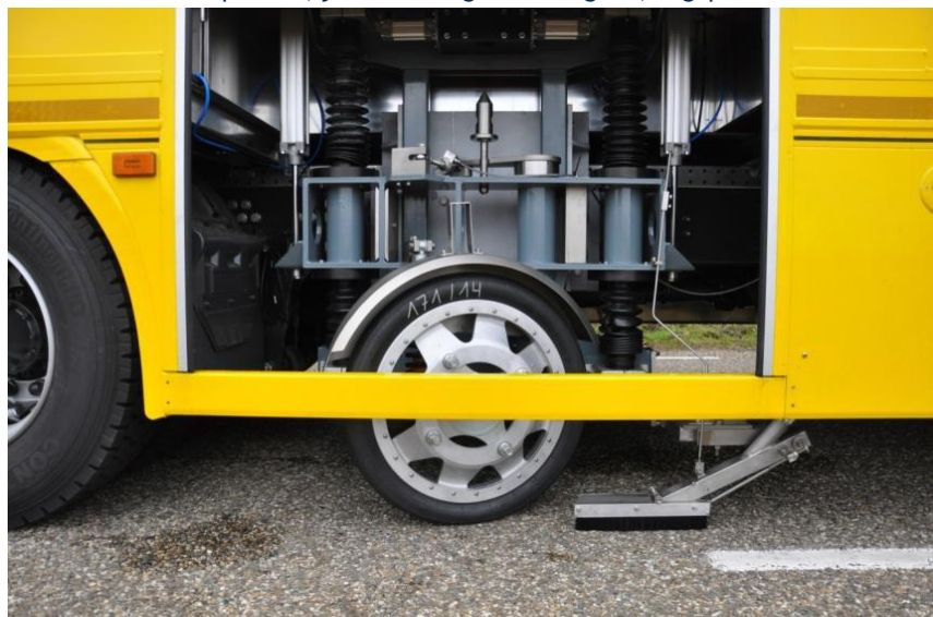
Abbildung 2 Messrad

Während des Transports ist das Messrad eingezogen. Bevor das Messfahrzeug in das Messfach fährt, wird das Messrad rechtzeitig gesenkt und in Kontakt mit dem Boden gebracht. Die statische Belastung (FN), die vom Messrad auf die Straße ausgeübt wird, beträgt 1960 \pm 10 N. Das Messrad ist mit einem standardisierten, flachen Messreifen versehen, mit einer Reifenspannung von 3,5 \pm 0,1 bar. Vom Messfahrzeug aus wird vor dem Messreifen, mithilfe einer Abflussanlage (Wasserschuh), ein Wasserfilm angebracht mit einer Breite von 80 mm und einer theoretischen Dicke von 0,5 mm, welche auf einer theoretischen, flachen Oberfläche berechnet wurde. Der Durchfluss der Pumpe wird, je nach Messgeschwindigkeit, angepasst.