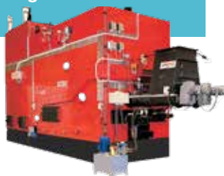
Fastbränsleledad panna kategori 2