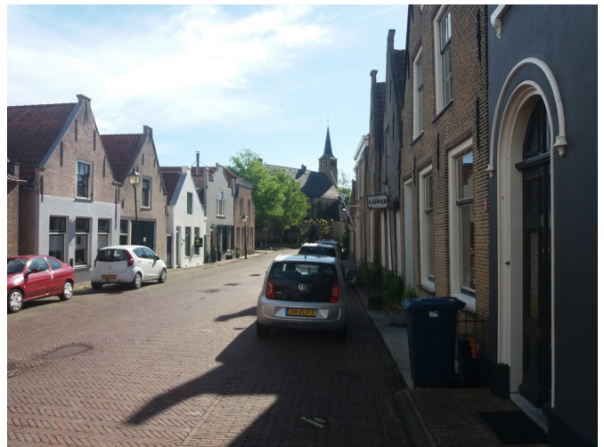
Een impressie van Stad aan 't Haringvliet.

Als er sprake is van een groot lek, dan is waterstof iets risicovoller dan aardgas. Het ontsteekt makkelijker en verbrandt sneller. Anderzijds produceert het daarbij minder warmtestraling en daarom is de kans op brandoverslag