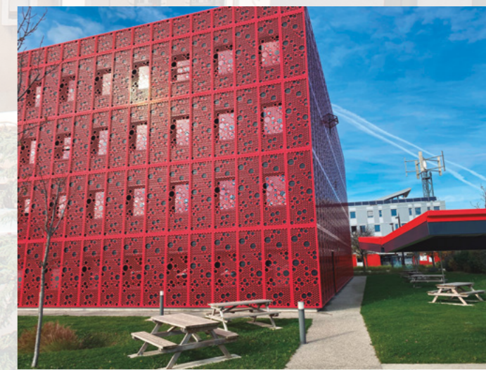
Oficina principal Kiwa Francia

Como no podía ser de otra manera las cosas del comer se cuidan mucho en la zona (¡no olvidemos que estamos en Francia!). La oferta gastronómica es rica y variada pero, puestos a elegir, un famoso pastel acapara la atención de los paladares más exigentes: se trata del famoso "suizo", a base de pasta brisa con cáscara de naranja confitada y aroma de azahar, y su peculiar forma de persona. Otra cosa que destaca y mucho en Valence y alrededores es la deliciosa oferta de quesos con personalidad propia. Podemos comenzar nuestra degustación con un poco de un saint-marcellin. Seguir con una porción de bleu de Vercors-Sassenage y continuar con la fuerte personalidad del picodon del Drôme. ¡Bon appetit!